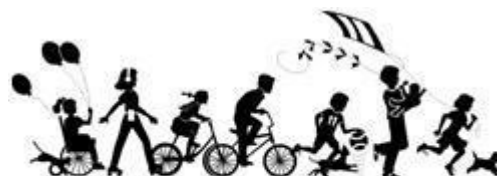
FOSTER & KINSHIP CARE EDUCATION PROGRAM AT LOS ANGELES CITY COLLEGE